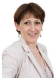
Caroline GADOU, Sous-préfète de la Tour-du-Pin

« L'accélération de la transition écologique est au coeur de la stratégie de relance : l'enjeu n'est pas de revenir aux modes et habitudes de production qui existaient avant la crise, mais de rendre notre économie plus durable.